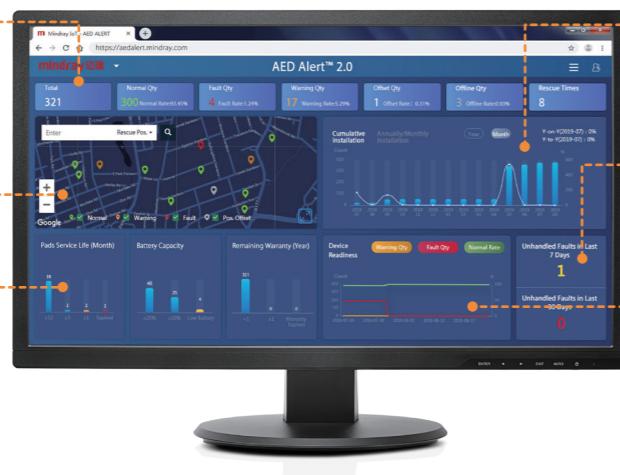
Grafico trend 1 anno/ 1 mese dei defibrillatori AED installati Somma di dispositivi AED con errore non gestito in 7/30 giorni Grafico trend 1 mese relativo a prontezza d'uso dei dispositivi AED

Panoramica prontezza d'uso: stato dell'autotest, fuori sede, stato della connessione 4G Mappa della prontezza d'uso del dispositivo AED Scadenza pad, capacità della batteria e garanzia del dispositivo in istogramma