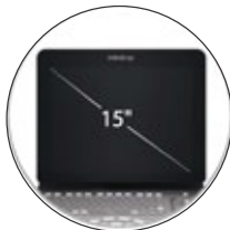
15" High Definition Monitor