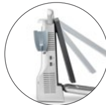
Neigbarer Monitor bis zu 60°