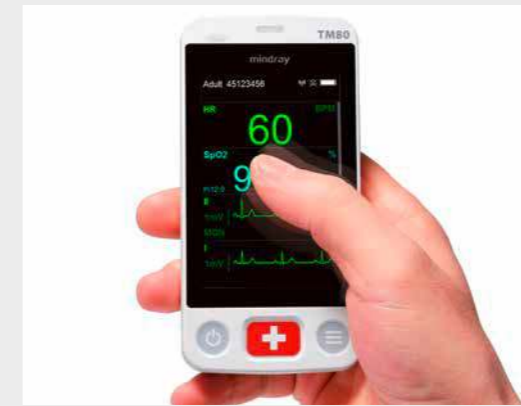
Leichte Handhabung wie bei einem Handy dank des 3,5-Zoll-Displays