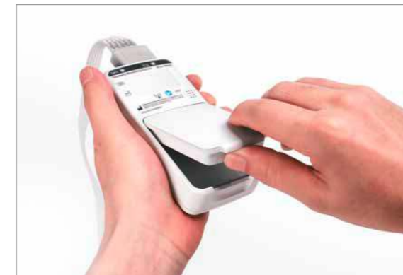
Austausch des Akkus in nur einem Schritt

Verwendung auf lange Sicht deutlich günstiger ist. Um die Betriebszeit zu verlängern, kommt ein Energiesparmodus zum Einsatz, der den Bildschirm schwärzt und den BeneVision TM80 dennoch in ständiger Bereitschaft hält. Der aktuelle Ladezustand wird im komfortablen Display permanent angezeigt.