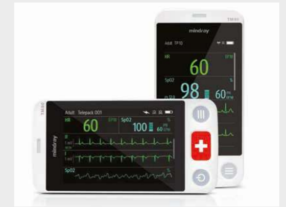
Einfach abzulesende Anzeige in der horizontalen und vertikalen Ansicht