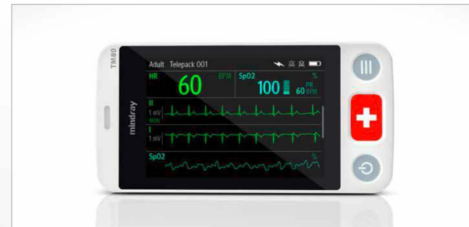
Der weltweit leichteste Telemetrie-Monitor hat ein 3,5 Zoll großes Touchscreen-Display.

Der BeneVision TM80 überzeugt als intelligente und innovative Monitoring-Lösung. Das mobile High-end-Produkt von Mindray ist klein, leistungsstark, mobil und einfach in der Handhabung. Jedes Detail des TM80 ist so konzipiert, dass es gehobenen klinischen Anforderungen gerecht wird und perfekt mit der entsprechenden Zentrale kommuniziert. Dank dieser Ergänzung zur Bene-Vision-Serie gelingt eine effizientere Behandlung ambulanter Patienten – nicht per Funk, sondern innerhalb eines drahtlosen Netzwerkes. Der BeneVision TM80 verfügt über die grundlegenden Funktionalitäten eines Monitors und den Komfort eines Smartphones mit integrierter Bluetooth- und WiFi-Funktion. Er ist eine clevere Ergänzung der Monitoring-Geräte von Mindray, die den Zeitgeist trifft und die Flexibilität im Klinikalltag deutlich erhöht.