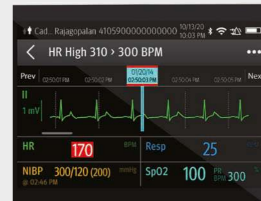
EKG-Trends und -Ereignisse auf dem TM80 überprüfen