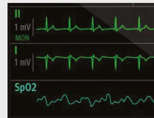
Anpassbare Darstellung der Kurven