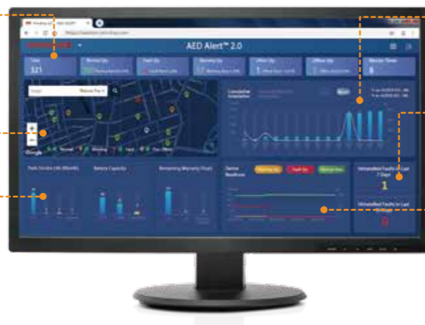
Gráfico de tendências de 1 ano/1 mês dos DEAs instalados

expiração de validade das almofadas, capacidade da bateria e garantia do dispositivo num histograma